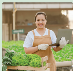
Sicurezza e Igiene Alimentare