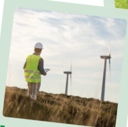
Energie rinnovabili: Eolica, Solare e Biomassa