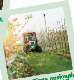
P.A.N. - Piano nazionale per l'uso sostenibile dei prodotti fitosanitari