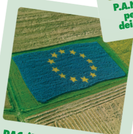
PAC (Politica Agricola Comunitaria)